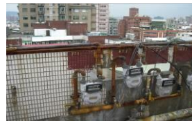
屋頂瓦斯表及管線