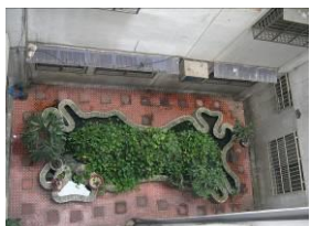
中庭水池易生病媒蚊