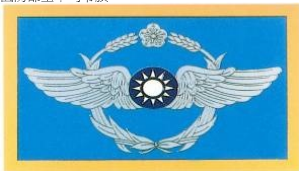
國防部空軍司令旗