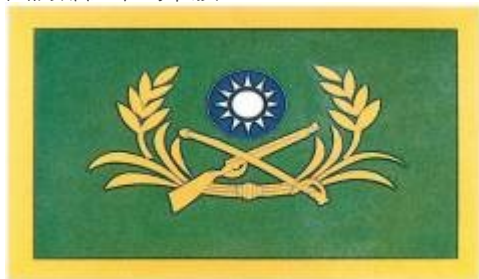
國防部陸軍司令旗