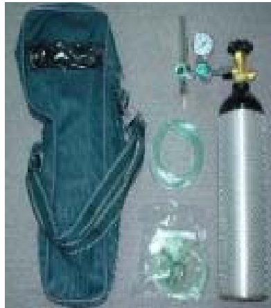
圖四 攜帶式氧氣組