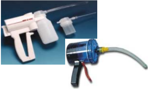
圖三 活動式抽吸器