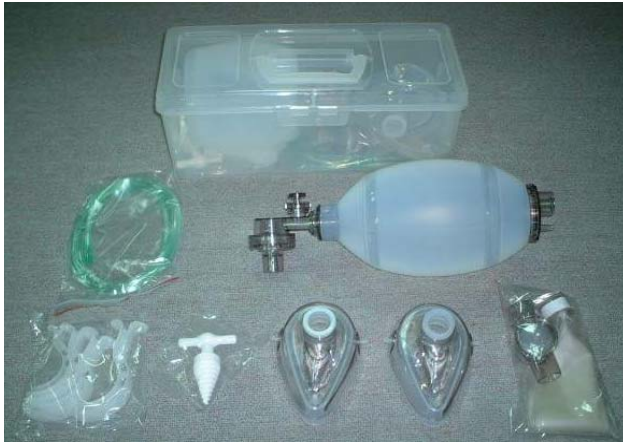
圖一 攜帶式人工甦醒器