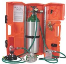
圖二-1：三合一甦醒器組合(範例一)

內容物：強迫給氣閥、減壓流量計、氣動抽吸器、 兒童用口呼吸道、成人用口呼吸道、成人 用氧氣面罩含 7 吋長導管、成人充氣式面罩 、高壓氧氣管(醫綠 6 吋長)、輪型轉盤含掛 鍊、塑膠攜行箱。