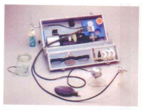
圖二-2：三合一甦醒器組合(範例二)

內容物：氧氣自動呼吸器、氧氣吸入器、吸引器、 加濕器、面罩、氣導管、鴨舌板、免感 染呼吸閥各式保持氣管暢通裝置。