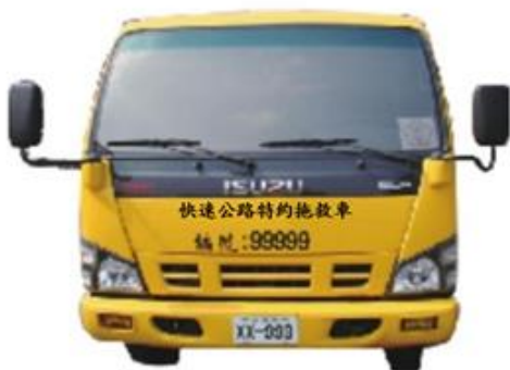
拖救車噴繪文字規定(正面)