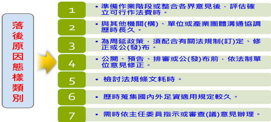
表 3 法案法制作業落後原因態樣類別表