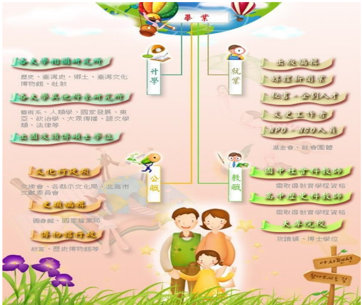
圖1.2 東華大學歷史學系生涯進路規劃圖

網址： http://www.dhist.ndhu.edu.tw/careerplan/doc/pages.php?ID=careerplan