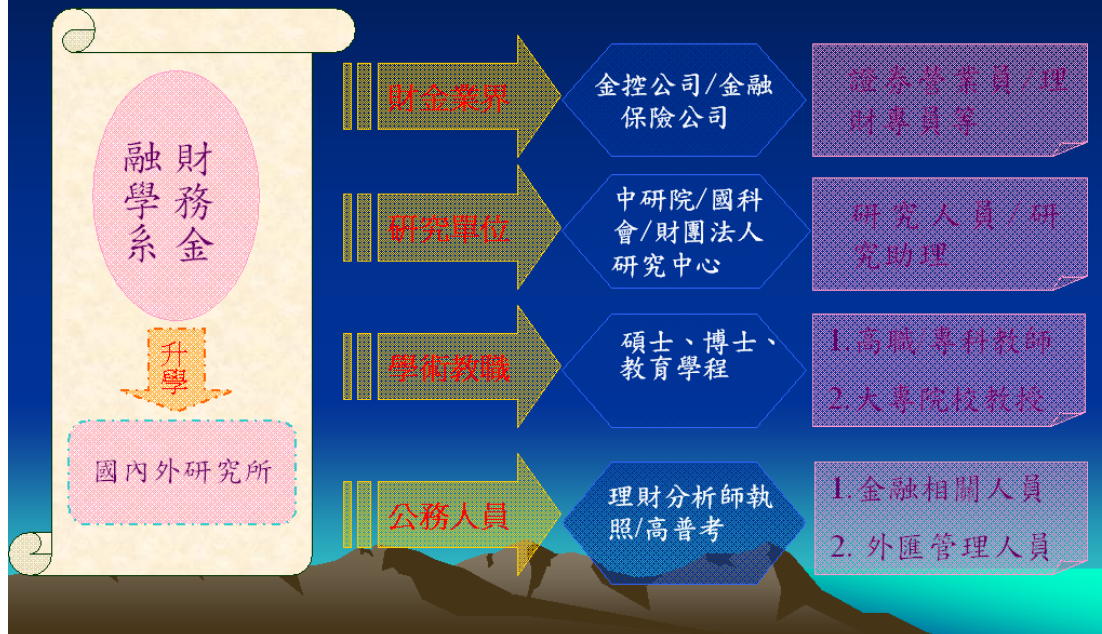
圖1.1 逢甲大學財務金融學系生涯進路規劃圖