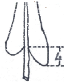
圖 4：性狀 1 4、葉基部形狀