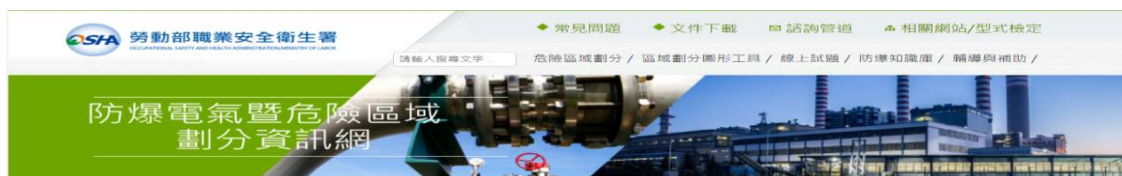
圖 3 防爆電氣暨危險區域劃分資訊網例

註：事業單位實施危險區域劃分時，可參考本署「防爆電氣暨危險區域劃分資訊網」相關資訊(如圖 3)，惟實際劃分時，仍應依用戶用電設備裝置規則、國家標準 CNS3376-10 或國際標準 IEC 60079-10 等相關規定辦理。( https://exproof.osha.gov.tw/content/tool/ZoneTool.aspx )。