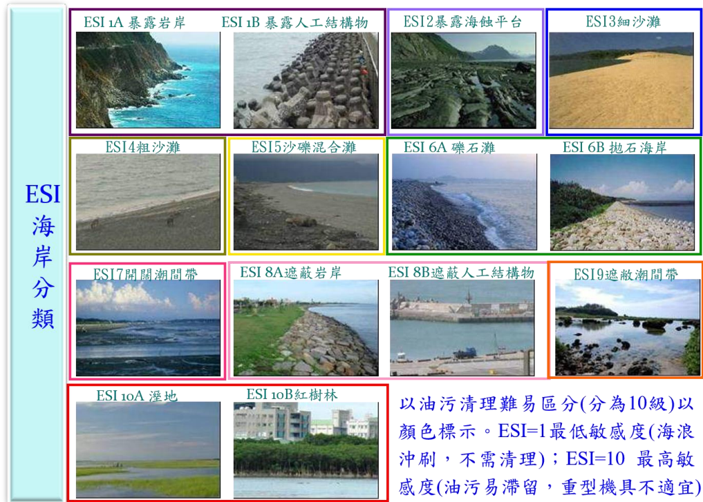
附圖 1 ESI 海岸分類圖

依「臺灣環境敏感指標(ESI)地圖海岸調查手冊」,有關海岸線類型區分為 10 類(如附圖 1),針對各類型海岸彙整建議適當之清污策略與作業方式,以為依循。