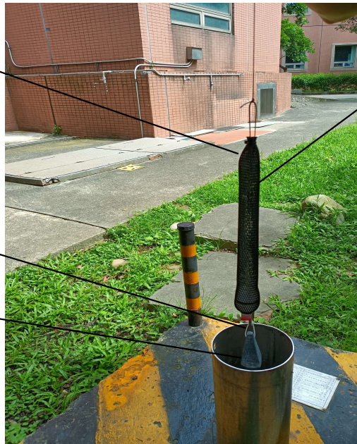
圖二 監測井地下水揮發性有機物被動式擴散採樣袋採樣