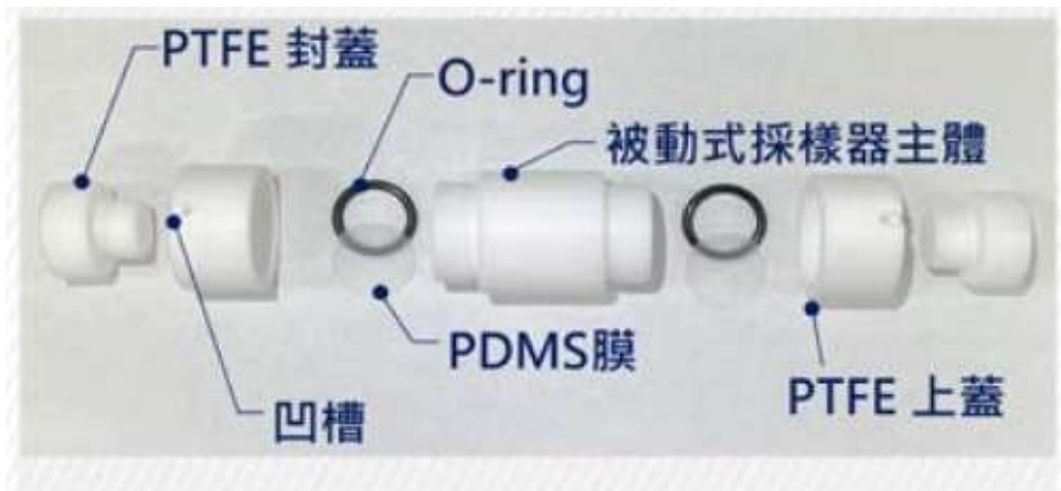
圖三 被動式採樣器