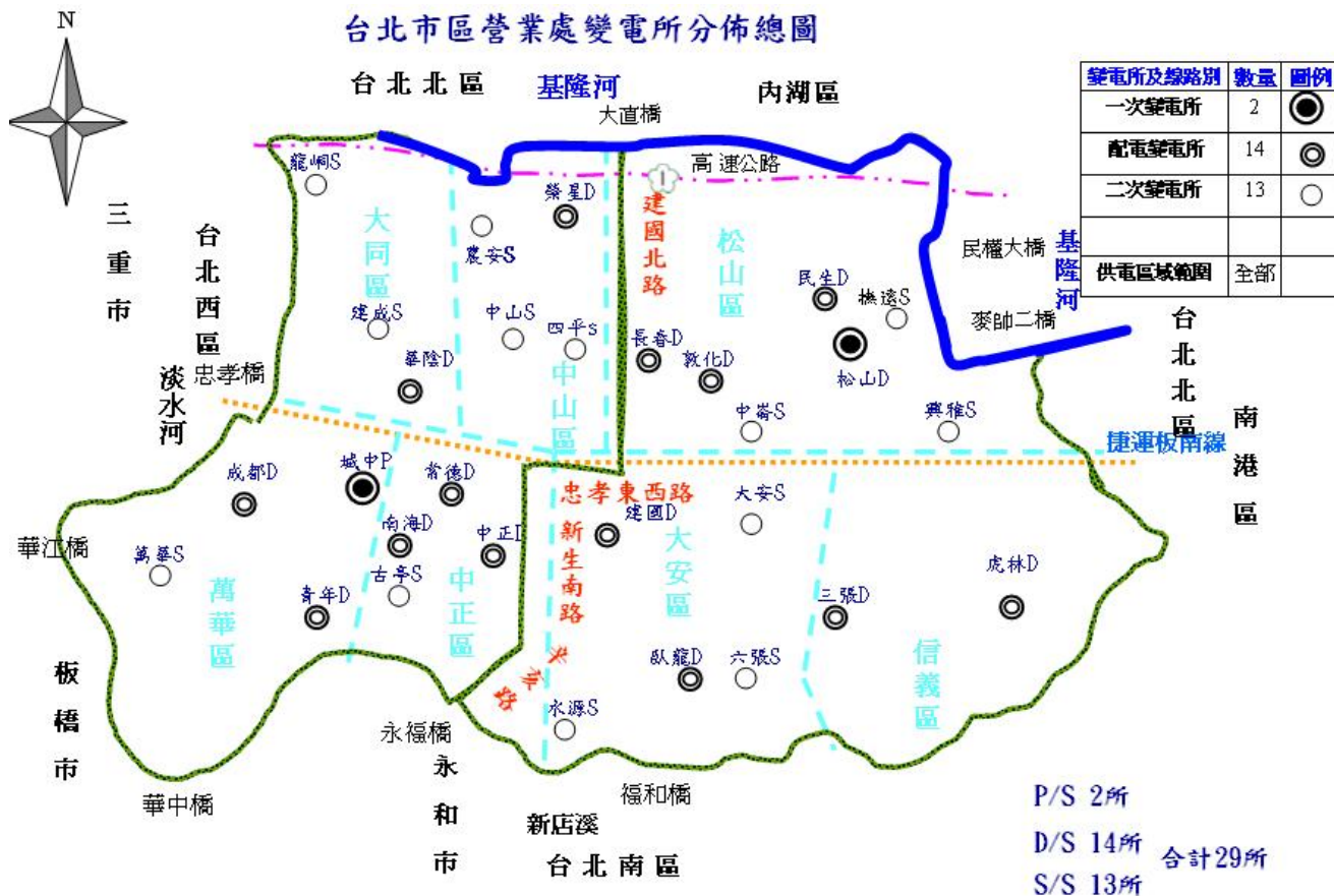
台北市區營業處變電所分佈總圖